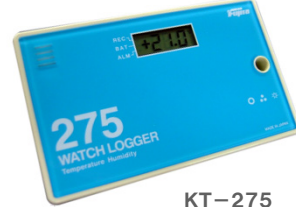
KT-275 センサー内蔵型 (税抜き)定価 11,800円