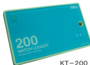
KT-200 センサー内蔵型 (税抜き)定価 9,800円