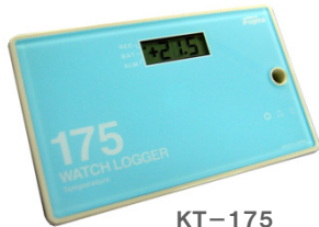
KT-175 センサー内蔵型 (税抜き)定価 9,800円