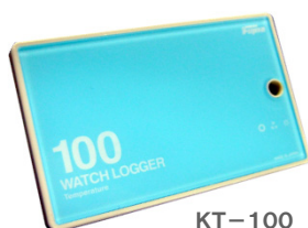
KT-100 センサー内蔵型 (税抜き)定価 7,800円