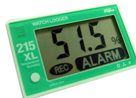
KT-215XL センサー内蔵型 (税抜き)定価 13,800円