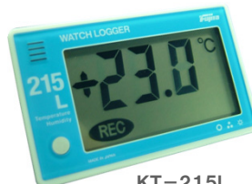
KT-215L センサー内蔵型 (税抜き)定価 12,800円