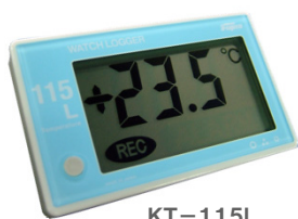
KT-115L センサー内蔵型 (税抜き)定価 11,800円