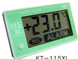
KT-115XL センサー内蔵型 (税抜き)定価 12,800円