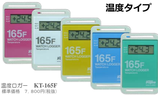
温度ロガー KT-165F 標準価格 7,800円(税抜)