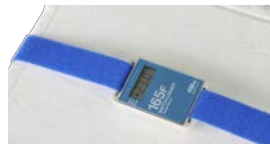
取付ベルト設置例