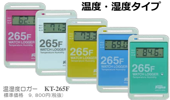
温湿度ロガー KT-265F 標準価格 9,800円(税抜)