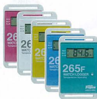
温湿度ロガー KT-265F 標準価格 9,800円(税抜)