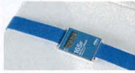
取付ベルト設置例