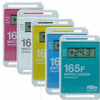
温度ロガー KT-165F 標準価格 7,800円(税抜)